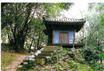
清水寺に模した観音堂