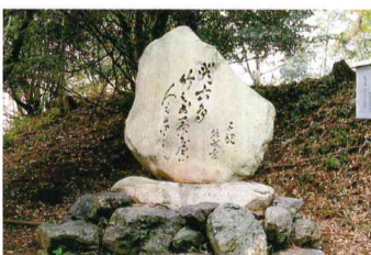
正岡子規の句碑・竹のお茶屋跡