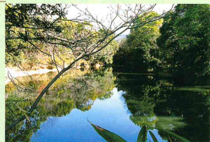
琵琶湖に模したお山池