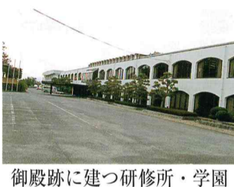
御殿跡に建つ研修所・学園

話し合うたび、『くわばら』が一番！と感じているのは私だけではないはず・・・やっと第2号完成です。少しずつ素敵なくわばらを紹介しますね。(記 今井典子)