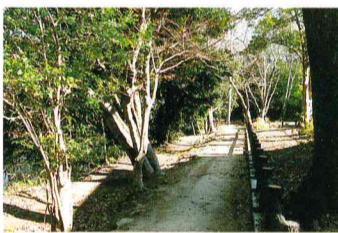
お山池周辺の歩道