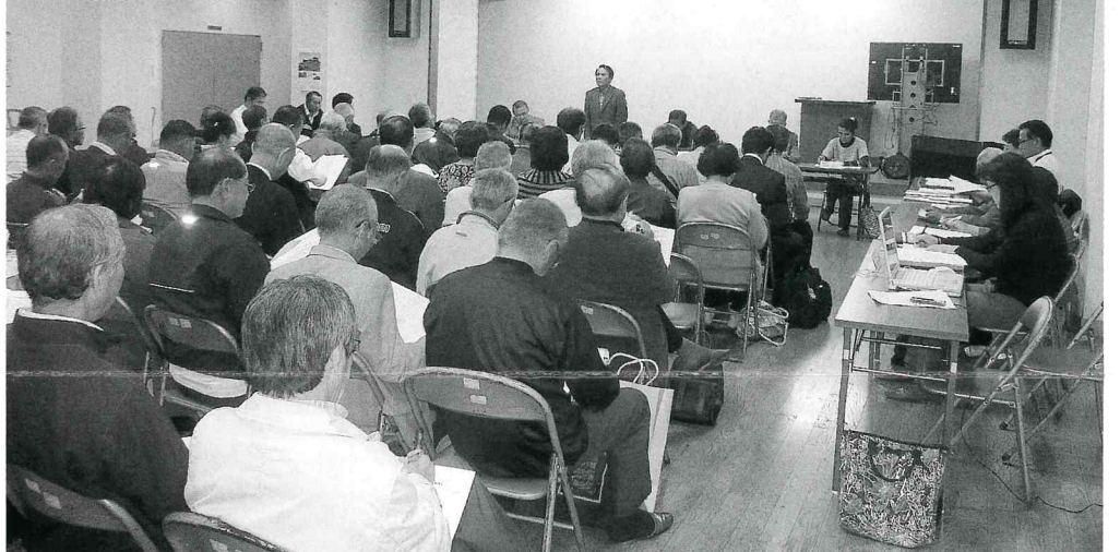
総会の様子。代議員の皆様、 ご出席いただきありがとうございました