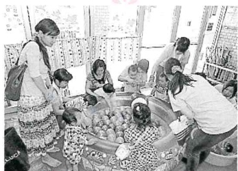
ヨーヨーつりもしたよ