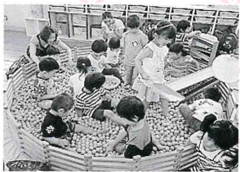
木のプール楽しかったよ