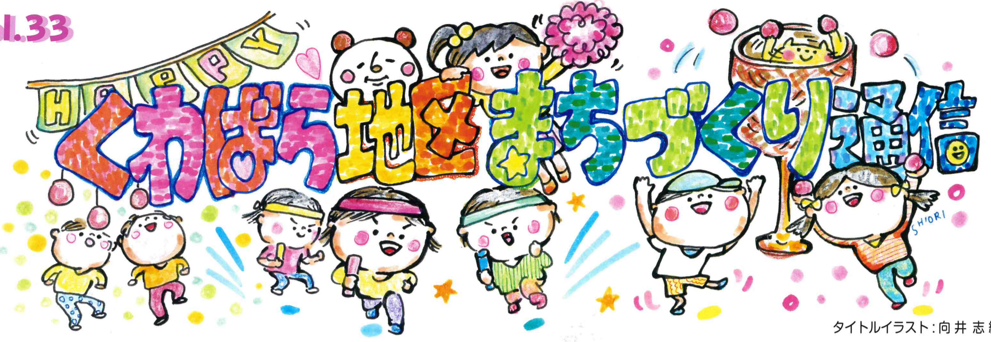
タイトルイラスト：向井 志織さん

桑原地区まちづくり協議会事務所 〒790-0911 松山市桑原二丁目 13-16 TEL・FAX 089-904-1821 E-mail:kuwa-machi@lib.e-catv.ne.jp