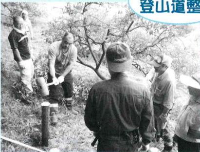
丸太の登山道整備